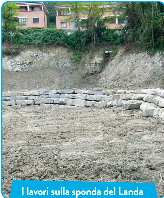
I lavori sulla sponda del Landa