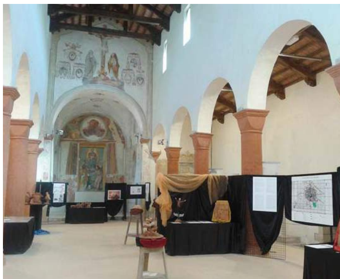
Interno del Museo della Badia